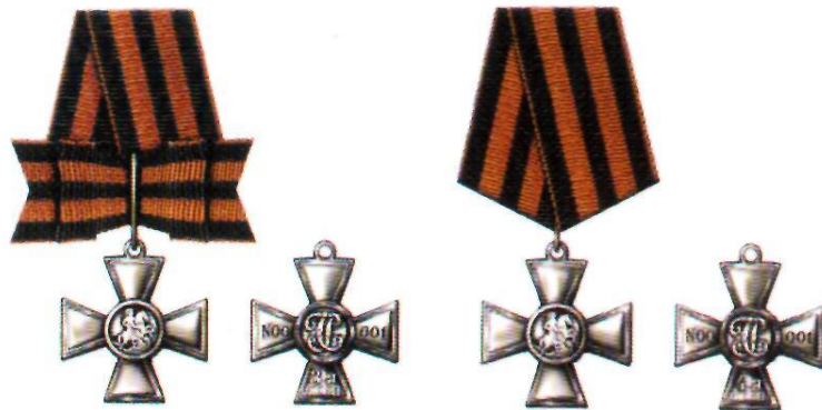
Знак отличия — Георгиевский Крест III степени