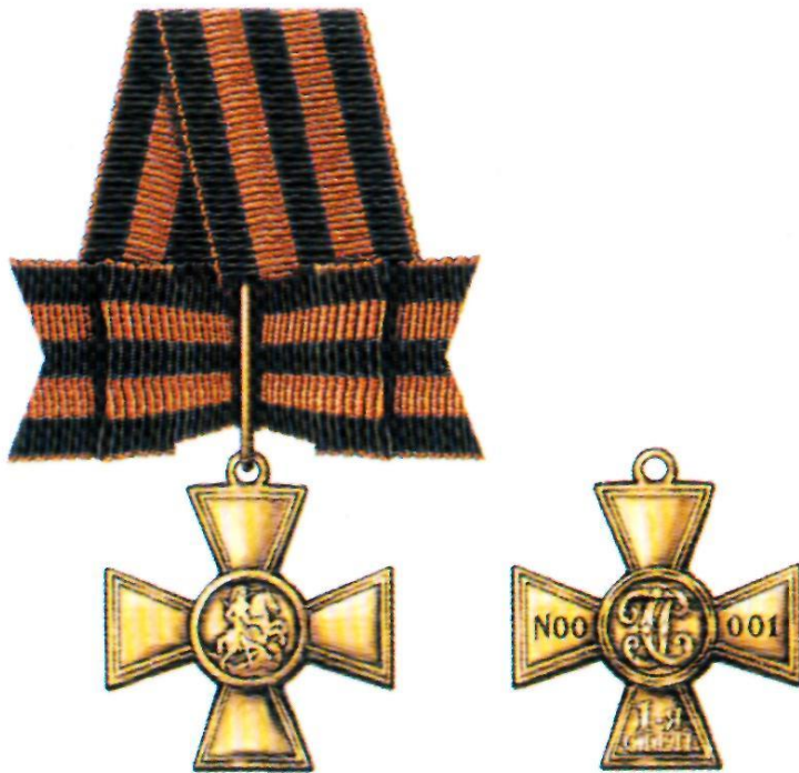
Знак отличия — Георгиевский Крест I степени

Знак отличия Военного ордена был учреждён в 1807 г., в 1913 г. он получил название Георгиевский Крест. Восстановлен 2 марта 1992 г.