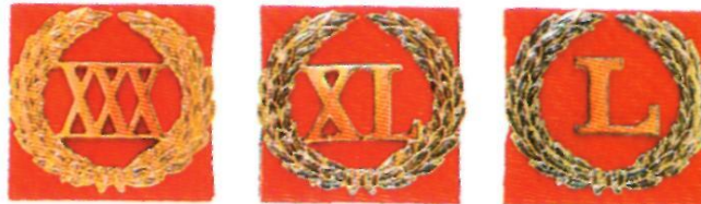
Знак отличия «За безупречную службу» (на ленте ордена «За заслуги перед Отечеством»)

Знак отличия “За безупречную службу” имеет градации: XV, XX, XXV и XXX лет.