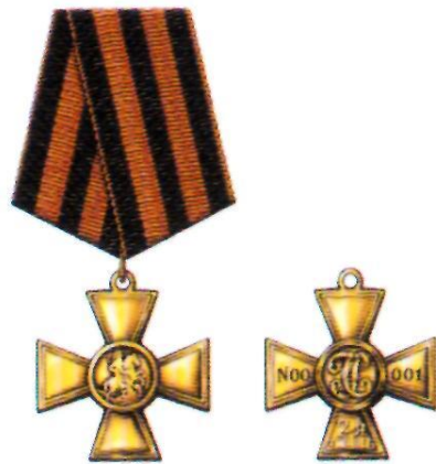
Знак отличия — Георгиевский Крест II степени