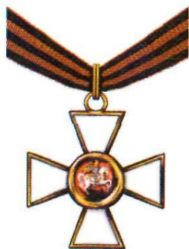
Орден Святого Георгия III степени