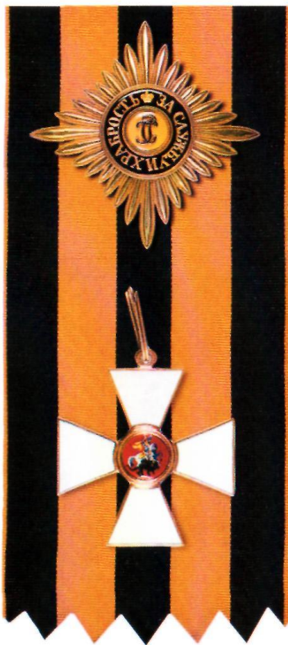
Звезда и знак ордена Святого Георгия I степени