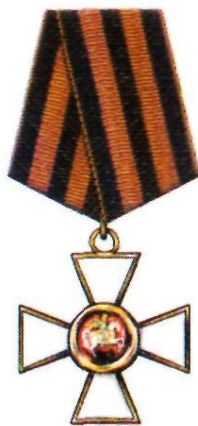
Орден Святого Георгия IV степени