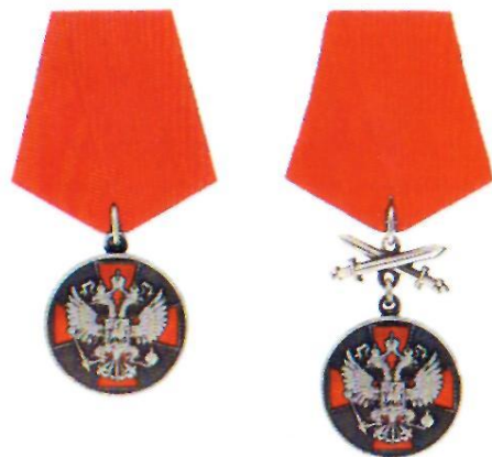
Медаль ордена «За заслуги перед Отечеством» II степени

Награждение медалью ордена “За заслуги перед Отечеством” производится за осуществление конкретных и полезных для страны дел в промышленности и сельском хозяйстве, строительстве и на транспорте, в науке и образовании, здравоохранении и культуре, в других областях трудовой деятельности; за успехи в поддержании высокой боевой готовности воинских частей и подразделений, за отличные показатели в боевой подготовке и иные заслуги во время прохождения военной службы; за укрепление законности и правопорядка, обеспечение государственной безопасности.