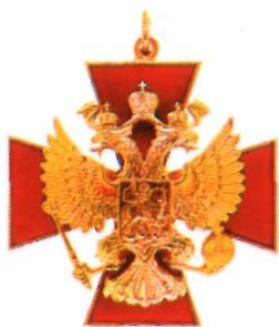
Орден «За заслуги перед Отечеством» III степени