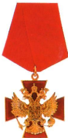
Орден «За заслуги перед Отечеством» IV степени

II степень. Тот же знак. Носится на шее на ленте шириной 45 мм. При знаке такая же звезда.