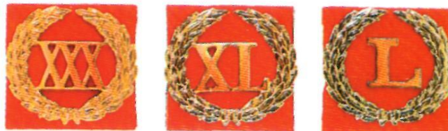
Знак отличия «За безупречную службу» (на ленте ордена «За заслуги перед Отечеством»)