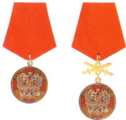
Медаль ордена «За заслуги перед Отечеством» I степени

Учреждена Указом Президента Российской Федерации от 2 марта 1994 г. № 442