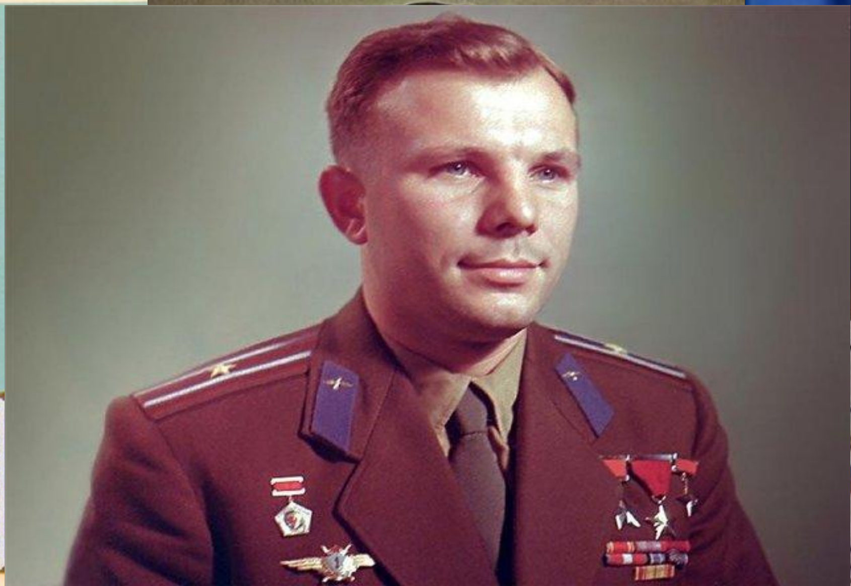
Гражданин Союза командир корабля «Союз», д.т.ч.и.д.у.м.р.навт подполковник Борис Валентинович ВОЛЬГОВ.