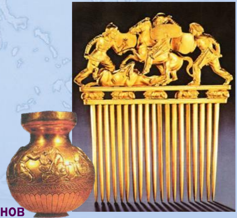
Золотые вещи из скифских курганов