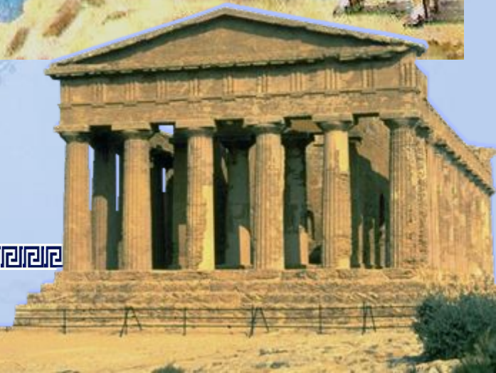
Храм Геры на о.Сицилия