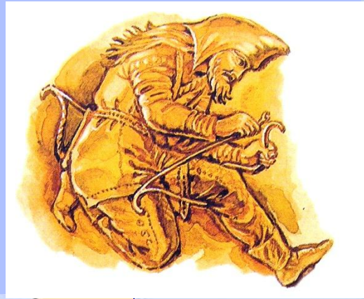
скифский лучник. Изображение на эвнегреческой вазе