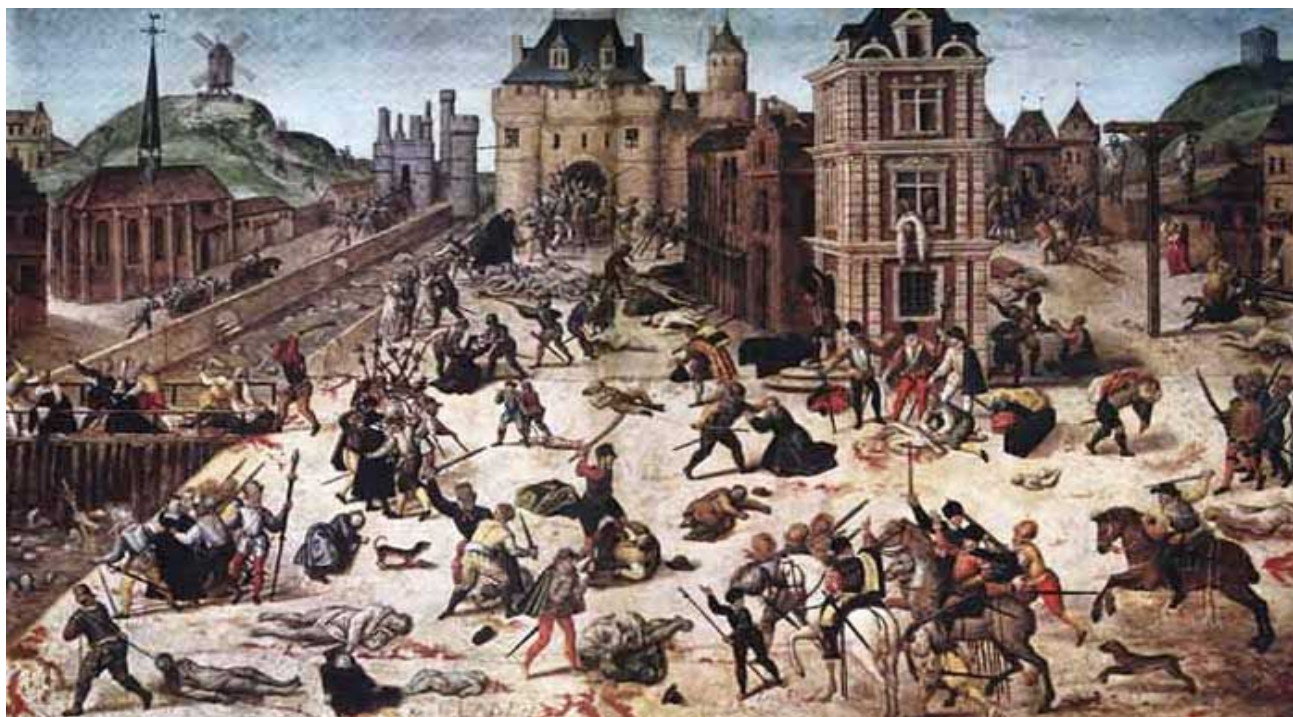
Варфоломеевская ночь. Художник Франсуа Дюбуа.