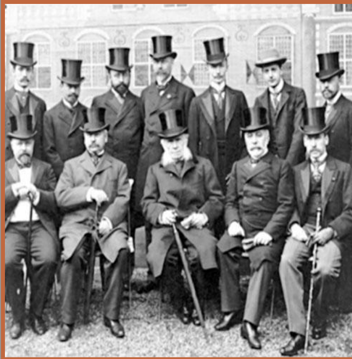
Участники Гаагской конференции

Рубеж XIX-XX вв. – индустриализация, борьба за рынки – передел мира.