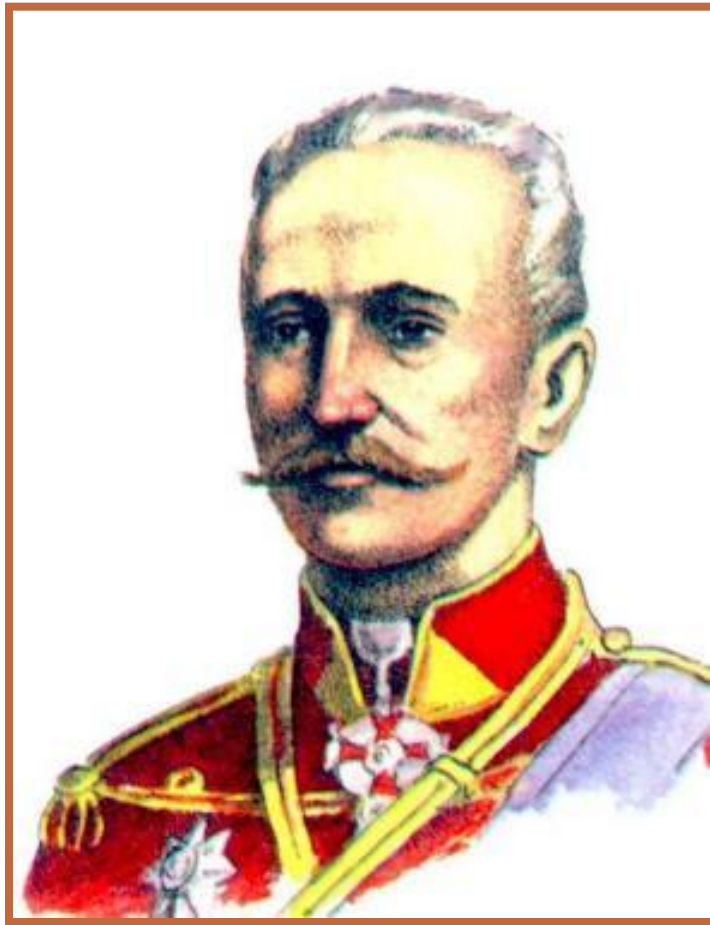
Русский генерал А.А.Брусилов

Летом 1916 г. в войне наметился перелом - Германия стала испытывать недостаток ресурсов.