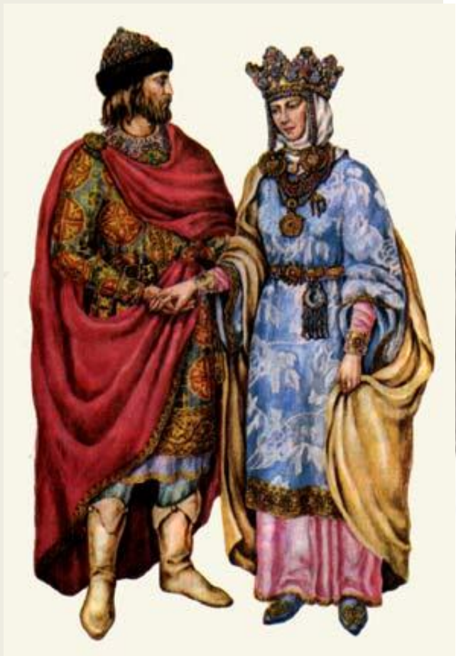
Князь и княгиня времен Киевской Руси