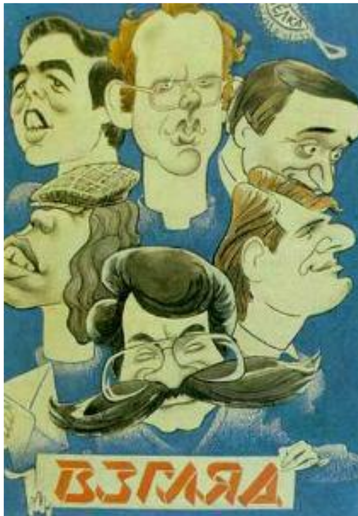
Шарж на ведущих Программы «Взгляд».

Ответ на эту статью последовал лишь через месяц, когда М.Горбачев вернулся из-за границы. После этого в СМИ критика тоталитарной системы развернулась с новой силой.