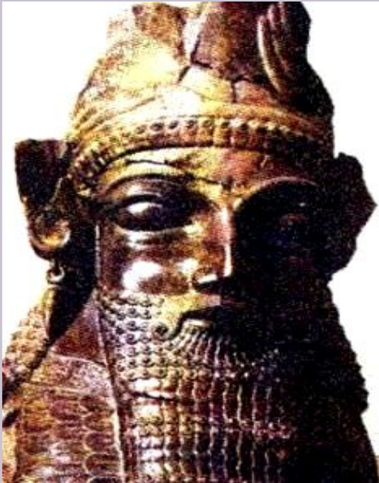
Статуя Дария I.

“Великий бог, который создал небо, землю и человека, Дария сделал царем, единым над многими царями” - говорили персидские мудрецы.