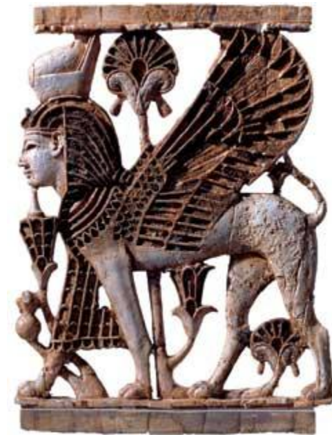
Украшение трона царя