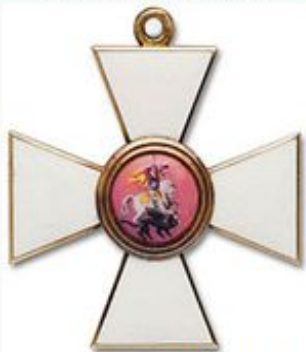
Знак ордена Св. Георгия 4-й ст. 1850-е годы