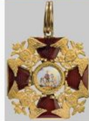
Знак ордена Св. Александра Невского (1820 - 90 гг.)