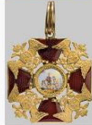
Знак ордена Св. Александра Невского (1820 - 20 гг.)