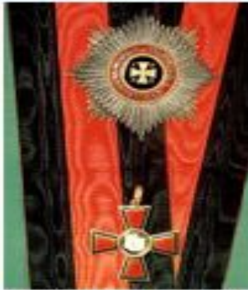
Звезда и знагордина Святого Владимира 1-й степени на орденской ленте

Орден Святого Владимира; Императорский орден Святого Павла-апостольного князя Владимира