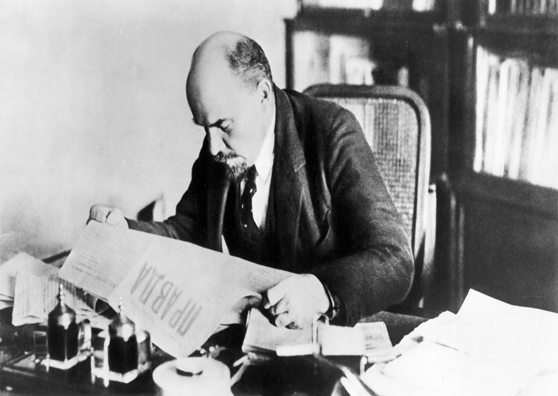
В. И. Ленин в своем кабинете в Кремле. 1918 г.