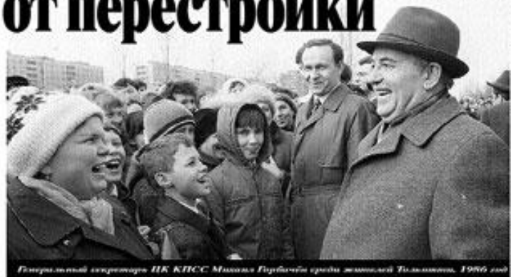
Генеральный секретарь ЦК КПСС Михаил Горбачев среди жителей Тельмана, 1986 год

Предприятия получили право внешнеэкономических связей, в том числе создания совместных предприятий и свободной продажи части своей продукции на внешнем рынке. Государство, таким образом, ослабило монополию на внешнюю торговлю, введенную в нашей стране в 1918 г.