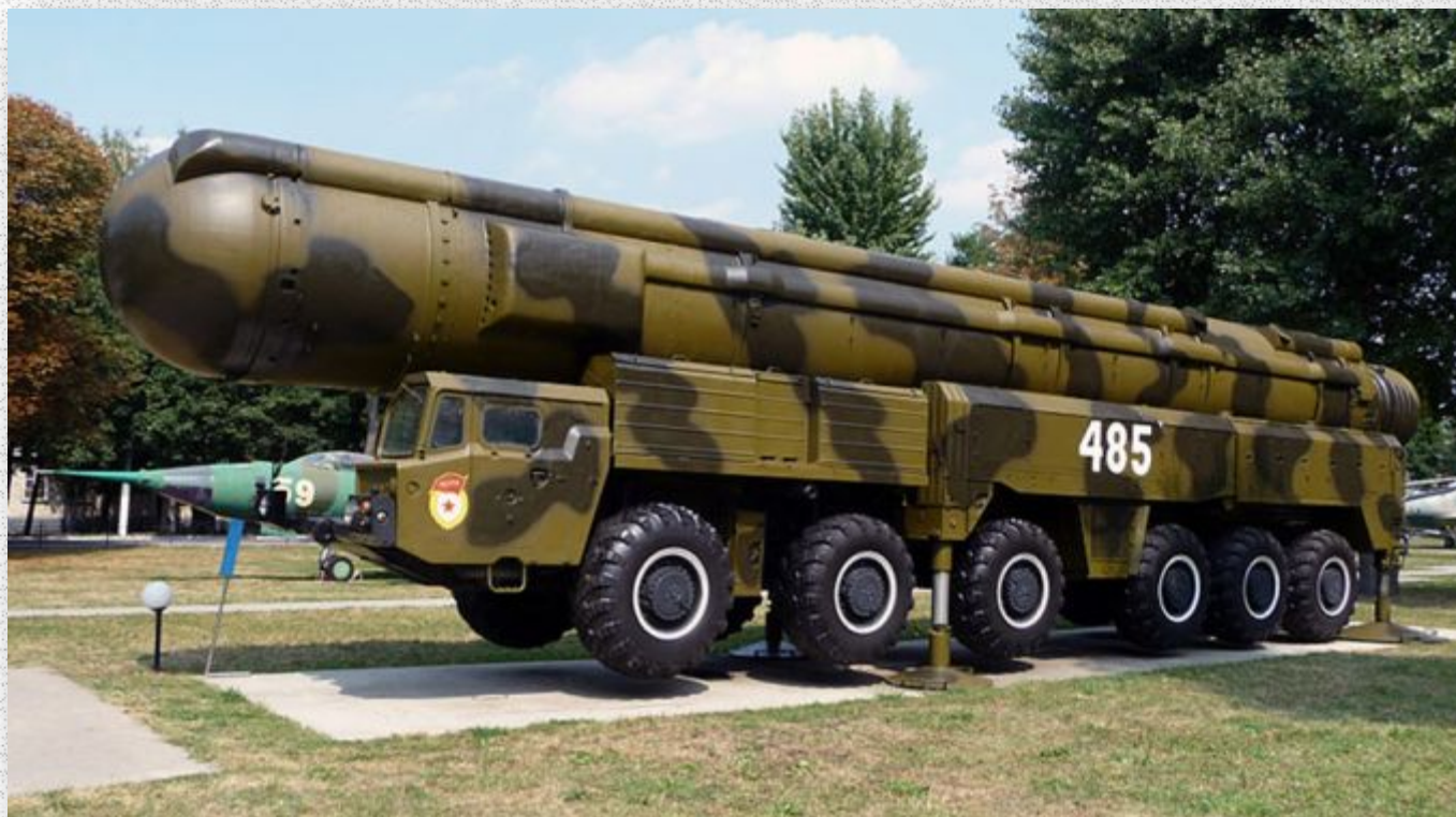
Ракетный комплекс средней дальности РСД-10 «Пионер» (SS-20) Принят на вооружение в 1976 году