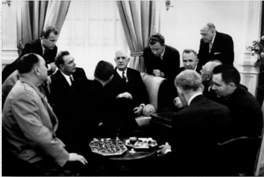
Встреча Л.И.Брежнев и Ш.де Голля в Москве, 1966 г.

Страны заключили договор о расширении политических, экономических и культурных связей. Обе стороны осудили американское вмешательство во внутренние дела Вьетнама, основали особенную политическую франко-русскую комиссию.