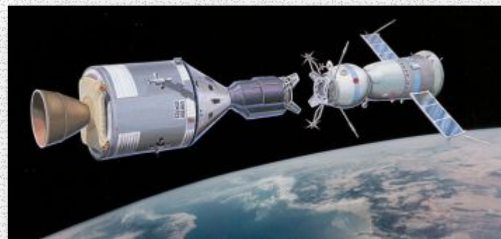
Союз-Аполлон (художественная реконструкция)

Экипажи - Томас Стаффорд, Вэнс Бранд и Дональд Слейтон (Аполлон), Алексей Леонов и Валерий Кубасов (Союз-19).