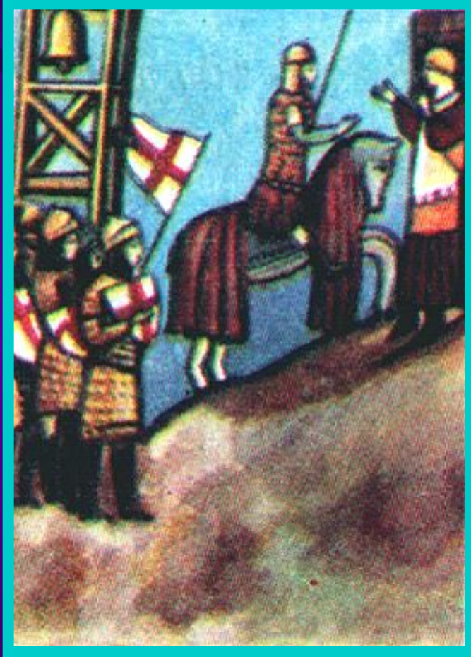
Победа гибеллинов при Монтаперти в 1260 г.

В это время образовались 2 политические группировки-Гвельфы(Вельфы) и Гибеллины(Вайблинген). Гвельфы стояли за папу, а Гибеллины за императора. Позднее в эти группы вошли соперничавшие города. Они выдвигали своих пап и императоров. Люди делали выбор из их, постоянно менявшихся взглядов.