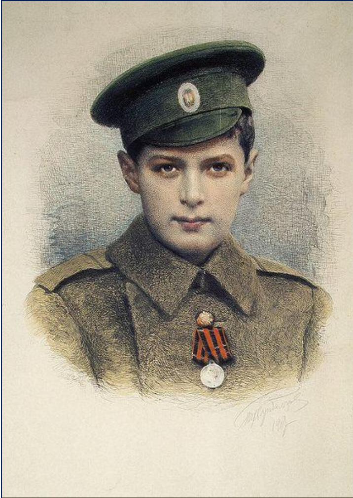
Сын Николая II- Цесаревич и Великий князь Алексей Николаевич. (1904-1918 гг.)

Общество ожидало от нового царя реформ, однако в своей первой публичной речи император заявил, что будет охранять основы самодержавия твердо и неуклонно, как его «незабвенный покойный родитель».