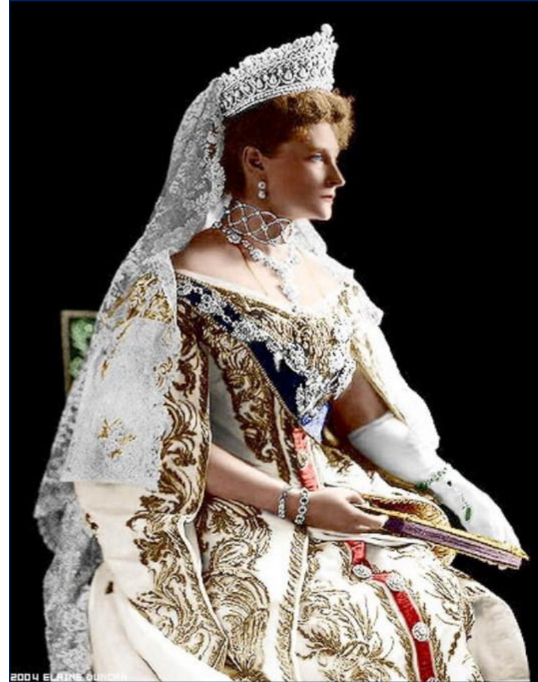
Императрица Александра Федоровна- жена Николая II