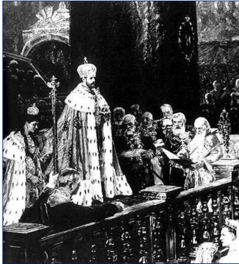
Коронация Николая II