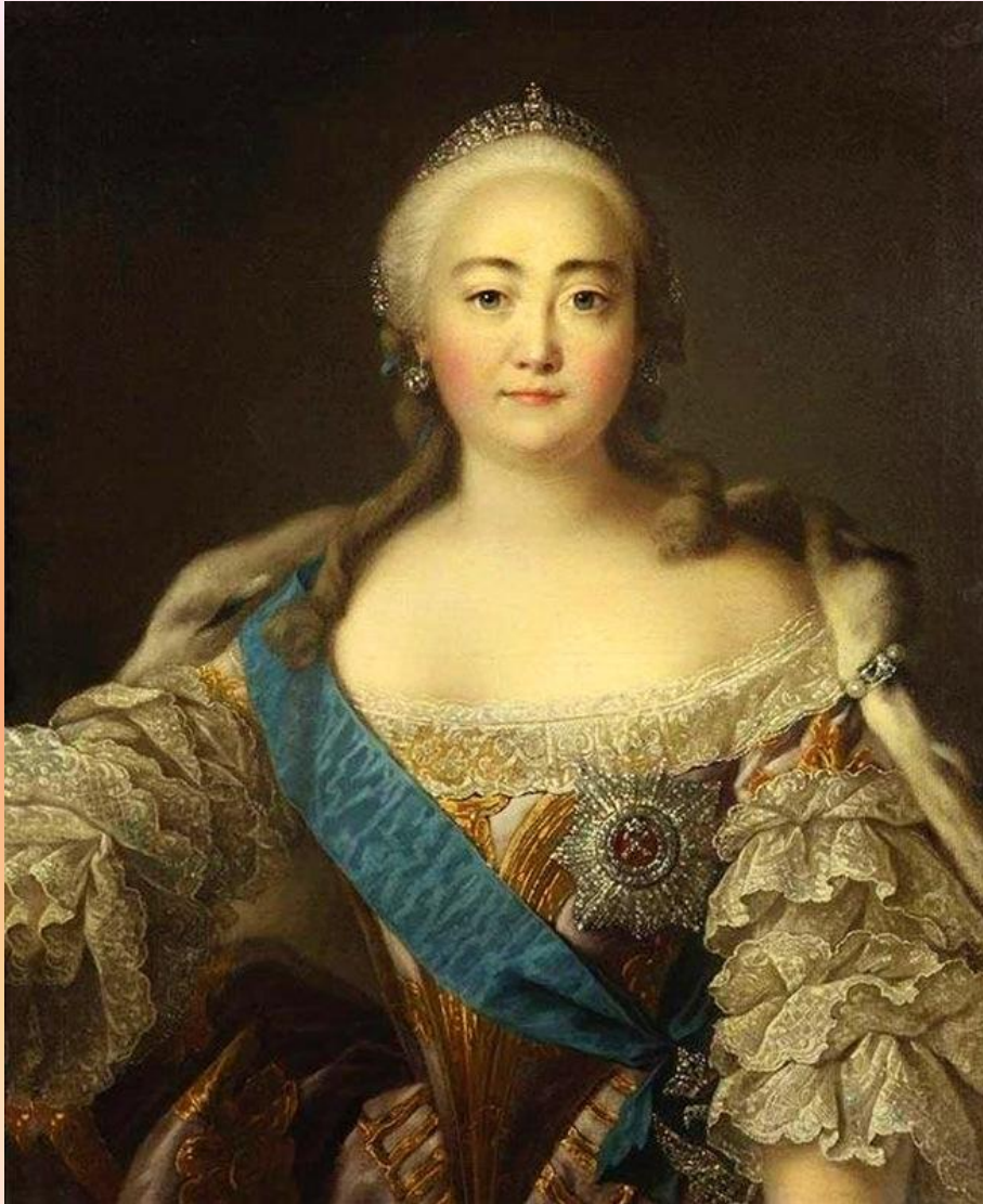
Елизавета Петровна Романова – императрица Елизавета I.