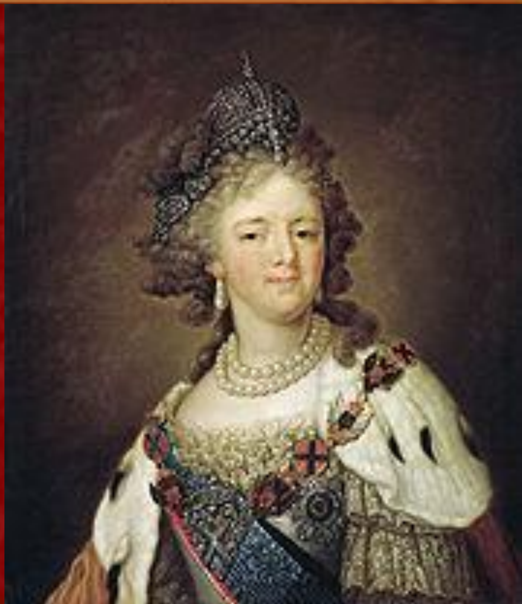
Доротея Вюртембергская — императрица Мария