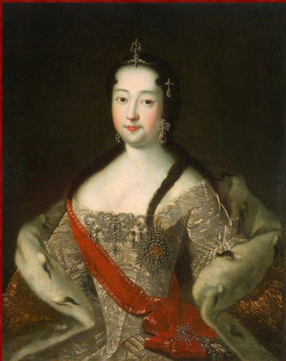
Анна Петровна, мать Петра III