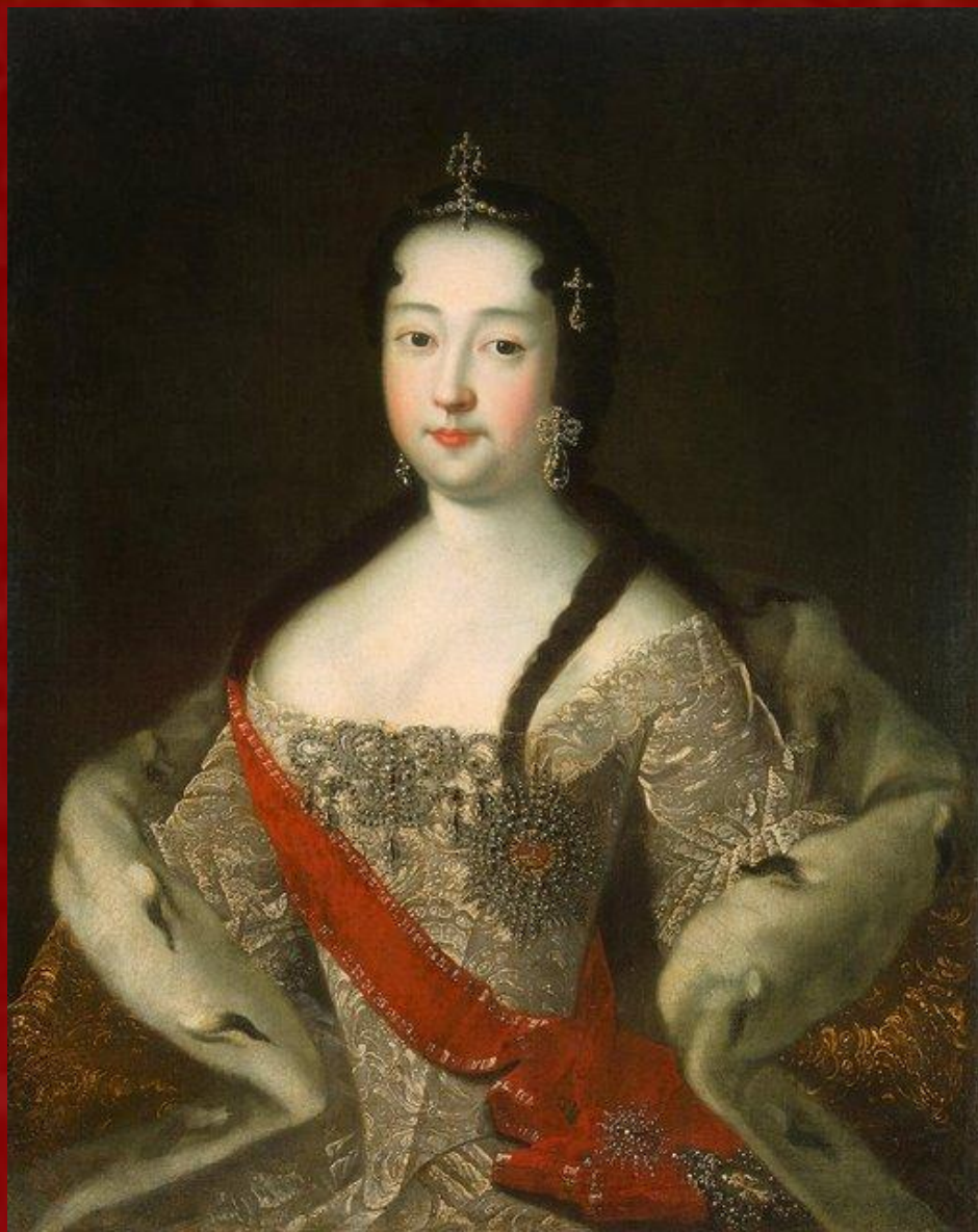
Анна Петровна, мать Петра III