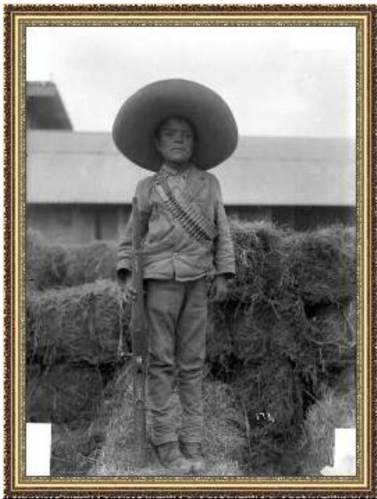
Мексиканский мальчик-солдат Освободительной армии

Борьба за Конституцию и буржуазные свободы. Партизанские отряды.