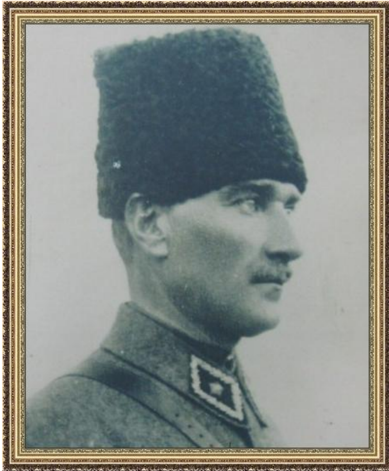
Мустафа Кемаль. Лидер младотурецкой революции

Иран – революция 1905-1911 гг. «Справедливость!». 1906 г. – Конституционный строй и менджлис, политические организации и СМИ. Противостояние Шах – Менджлис – вмешательство России и Англии – подавление революции. Сферы влияния.