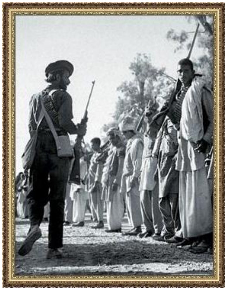
Индусы в колониальной армии

Причины революций — неуспех предшествовавших реформ.