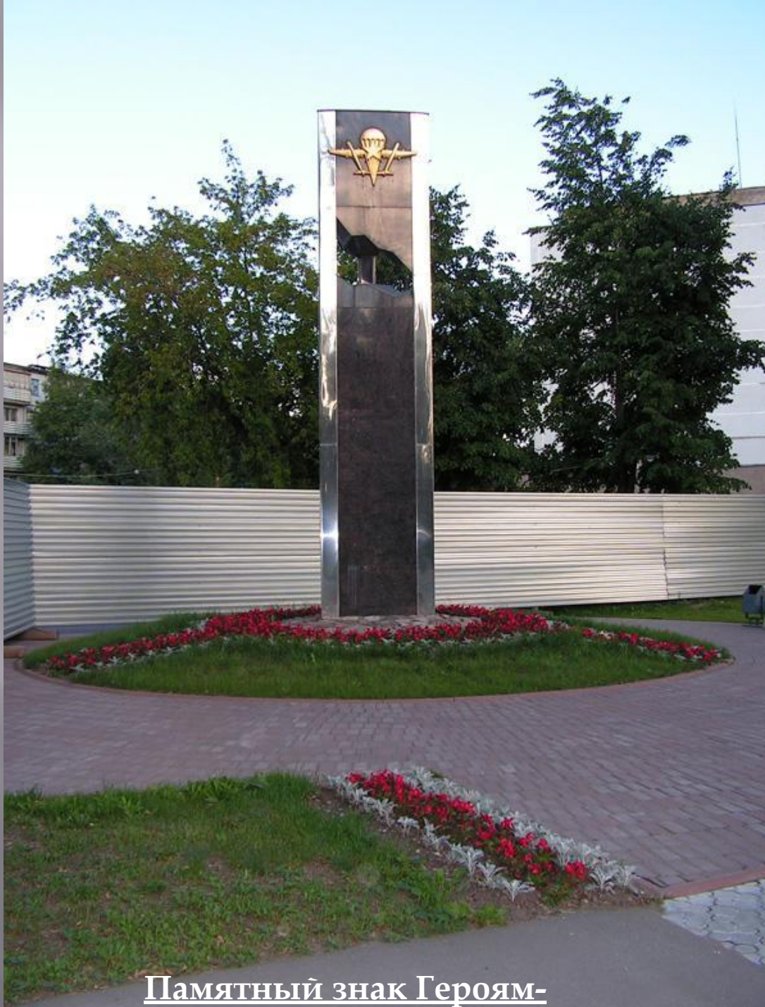
Памятный знак Героям-