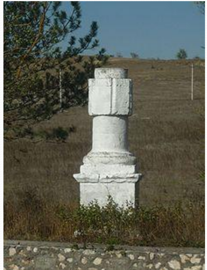
Екатери́нинская ми́ля по трассе Симферополь-Севастополь.

Екатери́нинская ми́ля — памятники истории и архитектуры, дорожные знаки, построенные в 1784—1787 годах на предполагаемом пути следования императрицы Екатерины Великой. Такие знаки были построены по распоряжению князя Григория Потёмкина через каждые 10 вёрст на дороге, по которой императрица должна была проехать с целью осмотра своих новых владений. Дорожные знаки были построены военными из известняка.