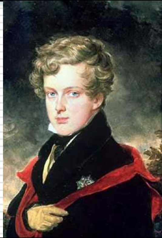
Наполеон II – сын Бонапарта

В 1810 г. Наполеон женится на дочери австрийского императора Марии –Луизе, подарившая ему наследника, который умер молодым.