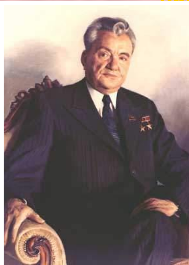
Д.А.Кунаев-1-й секретарь ЦК компартии Казахстана.

Демократизация общества привела к обострению межнациональных проблем. В н.1986 г.в Якутии студенты устроили демонстрацию под лозунгом «Якутия-для якутов». В декабре прошли массовые беспорядки в Казахстане вызванные заменой на посту 1 секретаря ЦК Д.Кунаева на Г.Колбина. Серьезное недовольство в Узбекистане вызвало расследование коррупции среди национального руководства. Наиболее остро национальный вопрос встал в Закавказье.