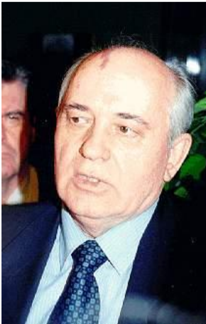
М.С. Горбачев после отставки. 25 декабря 1991 г.