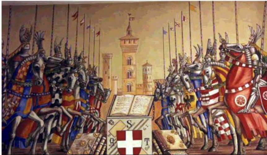
Гвельфы и гибеллины