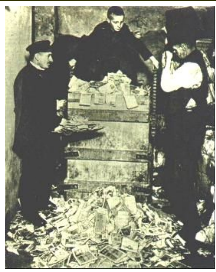
Финансовый кризис в Германии в 1920 г.

На выборах 1919 г. коммунисты не участвовали. Победу одержала СДПГ. в феврале 1919 г. в Веймаре Учредительное собрание приняло Конституцию.