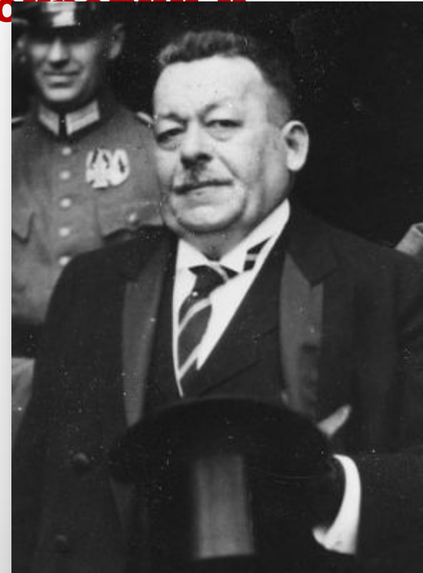
Фридрих Эберт, первый президент Веймарской республики