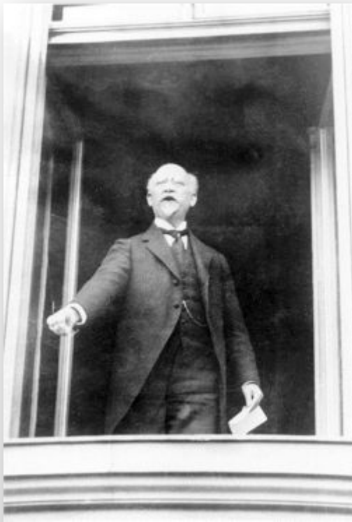
Филипп Шейдеман провозглашает республику 9 ноября 1918 г.

Введение всеобщего избирательного права Установление 8-часового рабочего дня Введение пособий по безработице