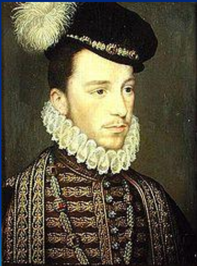
Генрих де Гиз