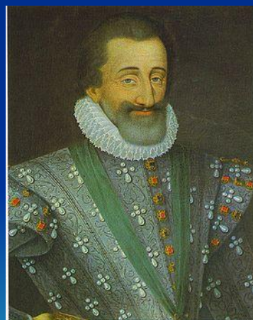
Генрих Бурбон Наваррский