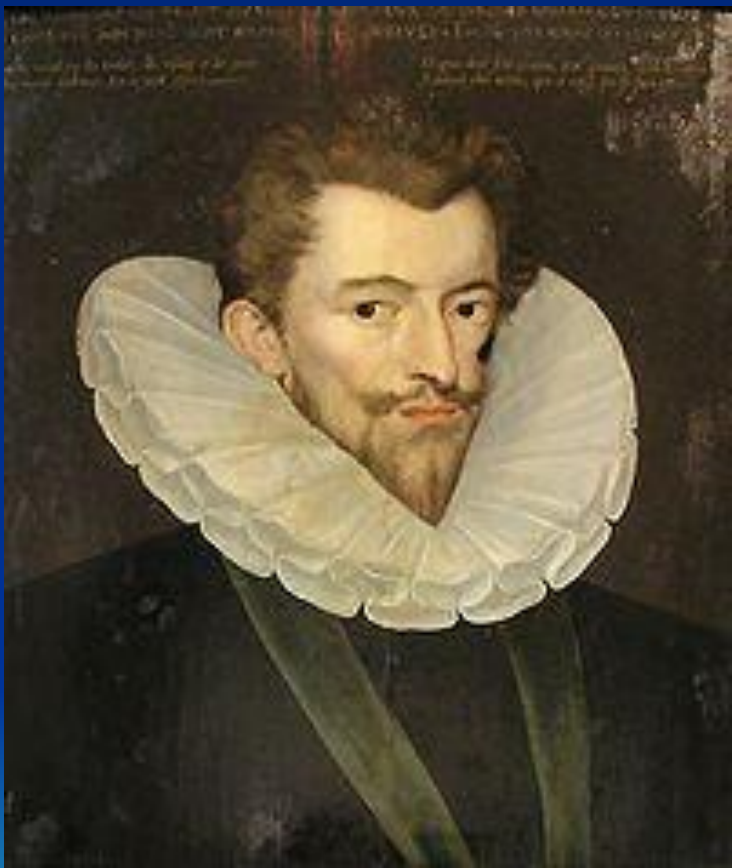
Генрих де Гиз