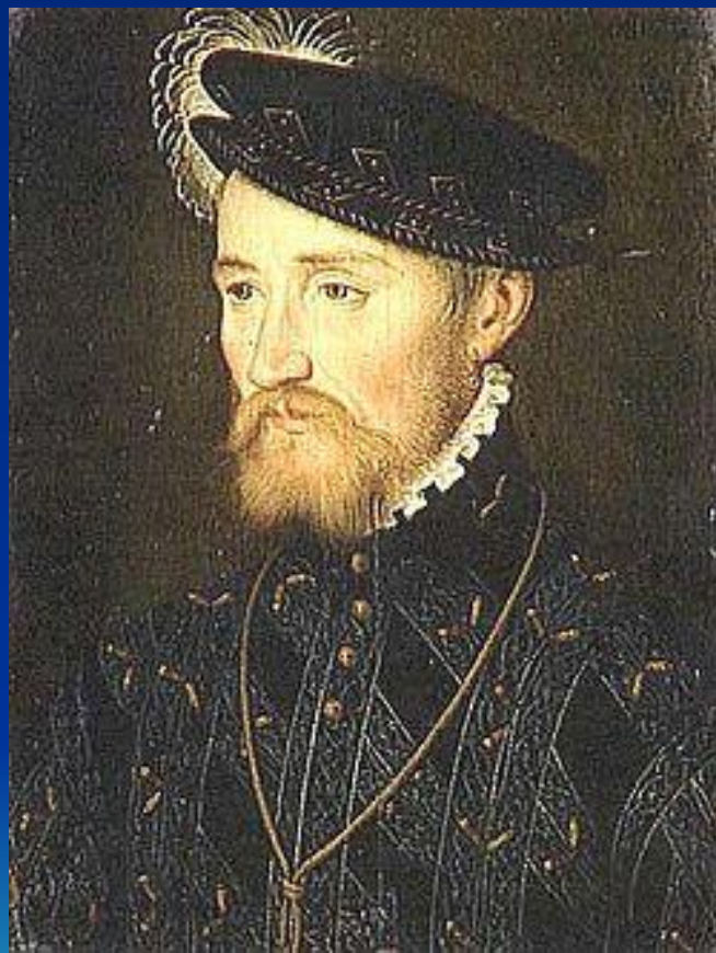
Франсуа де Гиз