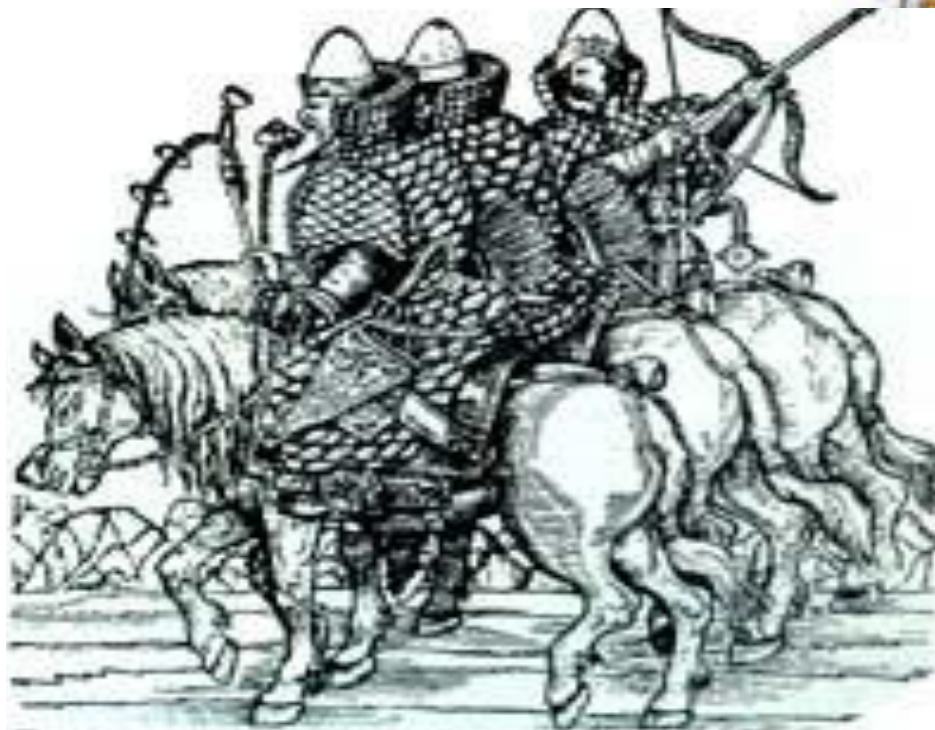
Дворянская конница в

В 1556 принято "Уложение о службе" - военная служба дворян переходила по наследству и начиналась с 15 лет. До этого возраста дворянин считался недорослем. В 1571 Воротынский М.И. составил первый военный устав, посвященный организации сторожевой и станичной службы.