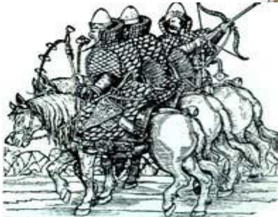
Дворянская конница в

В 1556 принято "Уложение о службе" - военная служба дворян переходила по наследству и начиналась с 15 лет. До этого возраста дворянин считался недорослем. В 1571 Воротынский М.И. составил первый военный устав, посвящённый организации сторожевой и станичной службы.