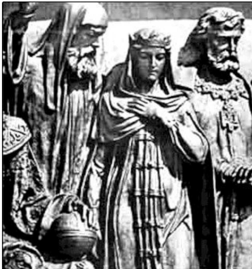
Протопоп Сильвестр, Анастасия Захарьина, Адашев А.Ф.

Избранная рада - сформированное в 1547-1549 (собиралась с 1548) неофициальное правительство (правительственный совет) Руси при Иване IV. В её состав вошли костромской дворянин из богатого, не знатного рода Адашев А.Ф., протопоп Благовещенского собора Кремля Сильвестр, имевший первоначально как духовник сильное влияние на царя, митрополит Макарий, князь Курбский А.М., дьяк посольского приказа Висковатый И.М. В состав Рады вошли дворяне, князя Воротынский М., Курлятев Д., Одоевский Н.