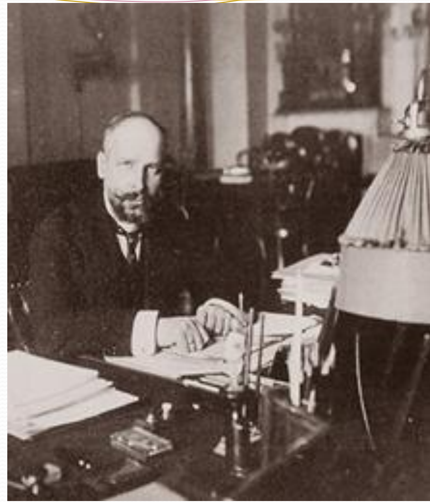
Одна из последних фотографий Столыпина. 1911 г.