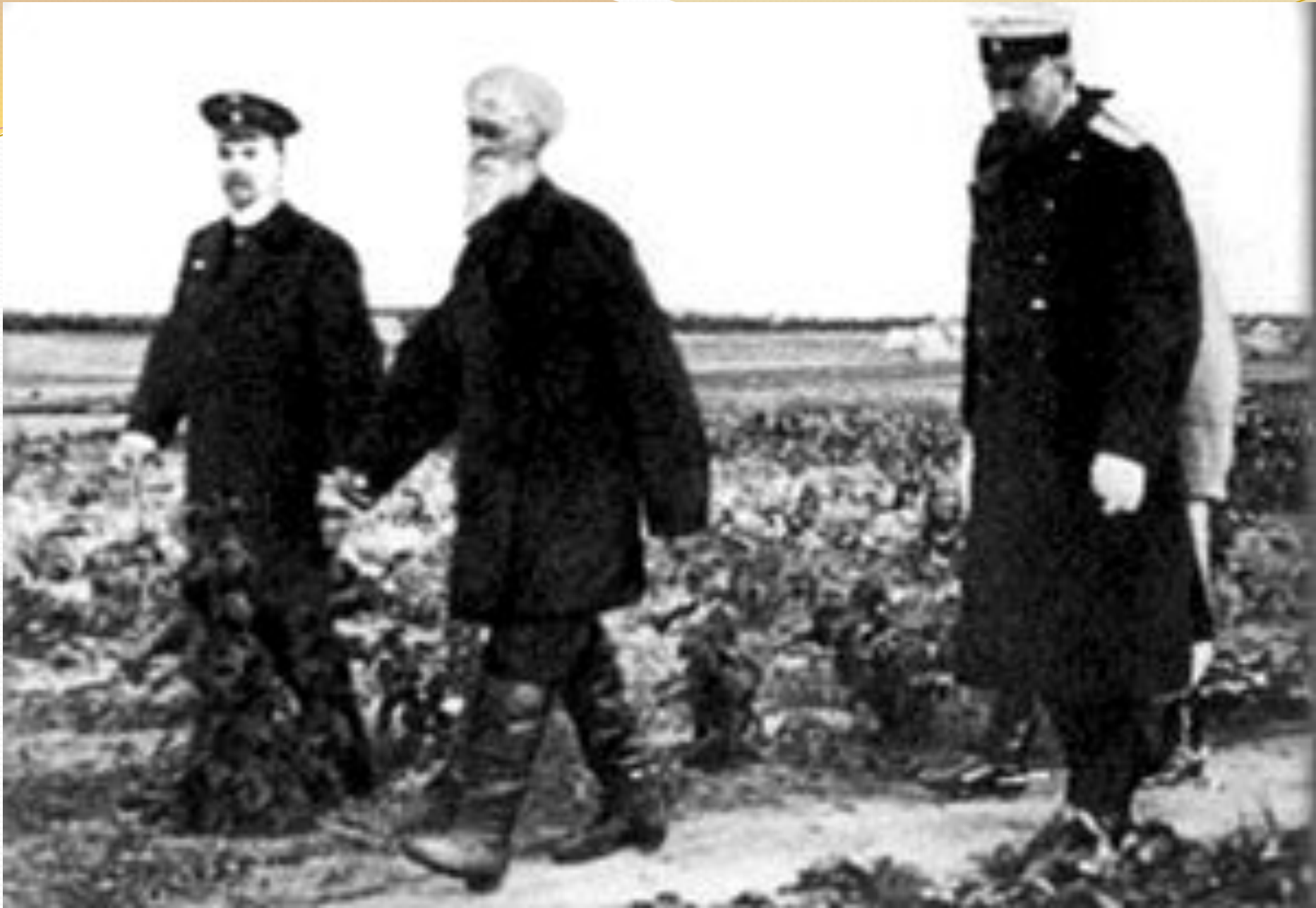
П.А.Столыпин осматривает хуторские огороды близ Москвы в апреле 1910 г.