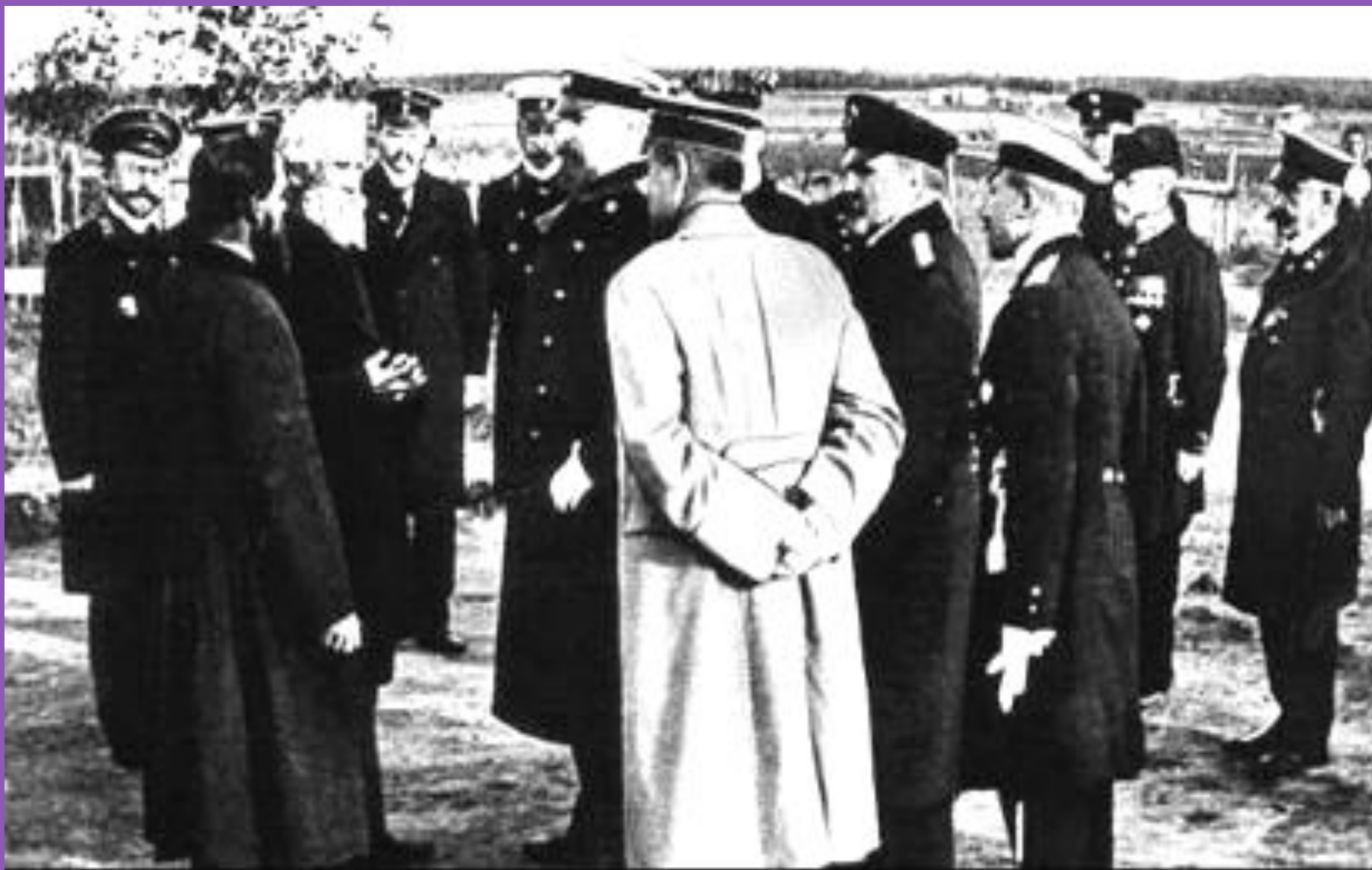
П. А. Столыпин в гостях у кулака.