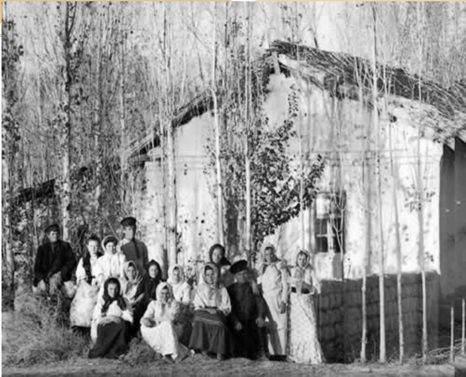
Русские переселенцы в Самаркандской губернии Туркестанского генерал-губернаторства.