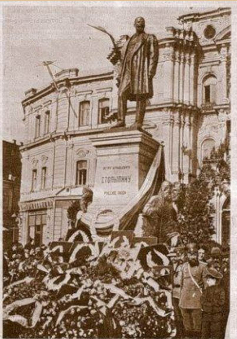
Открытие памятника покойному председателю Совета Министров П. А. Столыпину, в г. Киев, 2 сентября с. г. Памятник высотой 12 аршин. Пьедестал стальной, из светло-серого гранита. По сторонам пьедестала аллегорические фигуры Мещи (русской мещины) и Селян (русских крестьян). Памятник воздвигнут на главной улице Киева, Крещатке, против здания городской думы. Все сооружение обошлось в 120 тыс. руб. На открытии памятника съезжались министры, члены Гос. Совета и Гос. Думы, знавшие политический фракций, многочисленные депутаты и высшее духовенство. Через два дня, 7 сентября, состоялась закладка церкви в г. Столыпина Киевск. губ. в память ученической жены П. А. Столыпина.