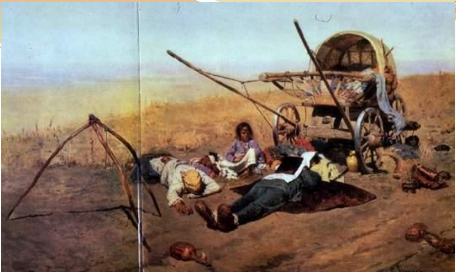
«В дороге...смерть переселенца»