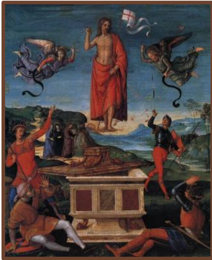
Рембрандт. Воскресение Христа

Возникновение христианства Иисус Христос в Иудее при императорах Августе и Тиберии. Осужден Понтием Пилатом и казнен в Иерусалиме. (Жертва ради искупления грехов человечества).