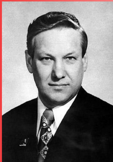
Б.Н. Ельцин (фотография 1970-х годов)

Б.Н. Ельцин родился 1-го февраля 1931 года в трудовой семье. Получил высшее строительное образование, работал на руководящих постах. В 1976 году занял должность первого секретаря Свердловского обкома, а затем стал членом ЦК КПСС. В октябре 1987 года был снят со всех постов из-за своих демократических убеждений. Спустя два года Ельцин был избран народным депутатом СССР и членом Верховного Совета. 12-го июня 1991 года состоялись выборы Президента РСФСР. Главой государства стал Б.Н. Ельцин.