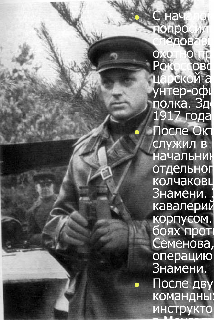
К. К. Рокоссовский на КП вблизи Варшавы, Ноябрь 1944 года.