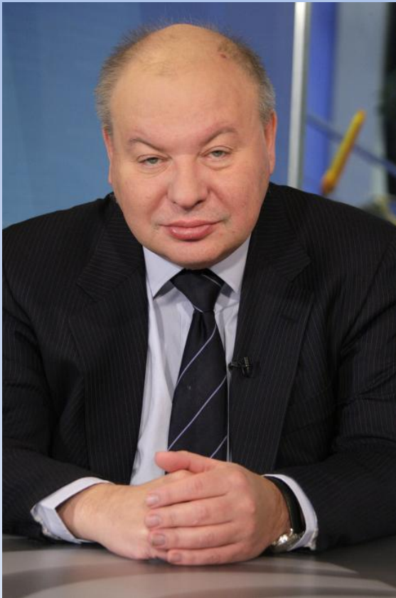
Гайдар Егор Тимурович

Новым председателем правительства стал В.С.Черномырдин.