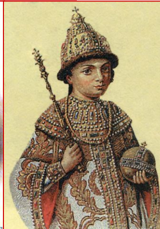
Петр Алексеевич Романов (1682-1725)