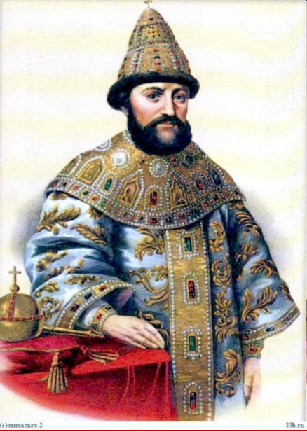
Михаил Федорович Романов (1613-1645)