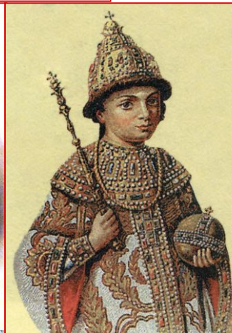
Петр Алексеевич Романов (1682-1725)