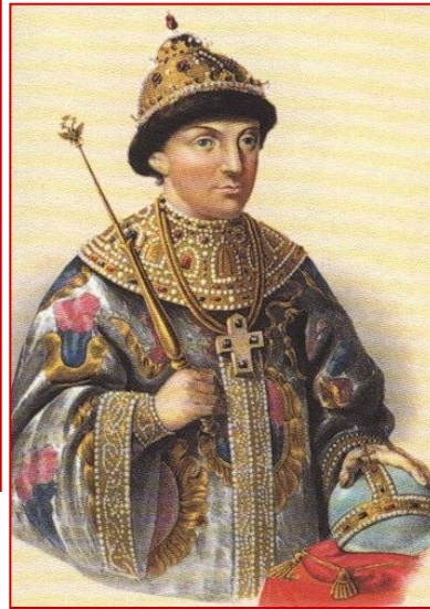
Федор Алексеевич Романов (1676-1682)