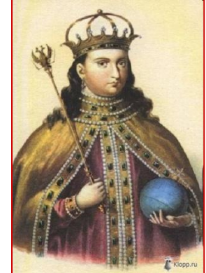
Царевна Софья Алексеевна (1682-1689)