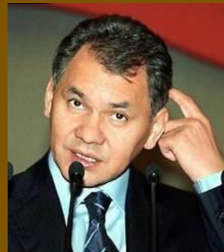
Министр МЧС С.К. Шойгу