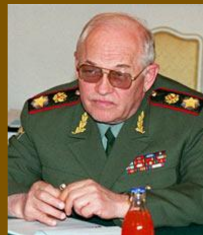
Министр обороны маршал РФ И.Д. Сергеев