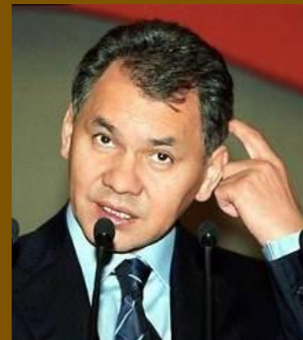
Министр МЧС С.К. Шойгу