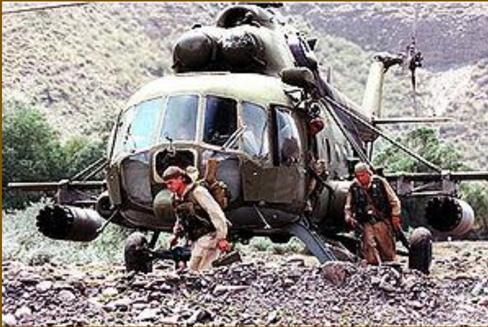
Высадка десанта в Дагестане. 25 августа 1999г.

Бои с террористами, вторгшимися в Дагестан 7 августа, продолжались более месяца. В это время в нескольких городах России были осуществлены крупные террористические акты - в Москве, Волгодонске и Буйнакске были взорваны жилые дома. Погибло множество мирных жителей. Вторая чеченская война значительно отличалась от первой. Ставка на слабость российской власти и армии не оправдалась. Общее руководство новой чеченской войной взял на себя новый российский премьер Владимир Путин.