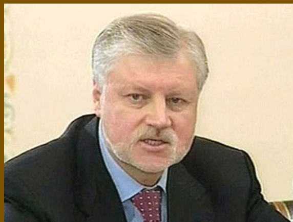
Председатель Совета Федерации С.М. Миронов