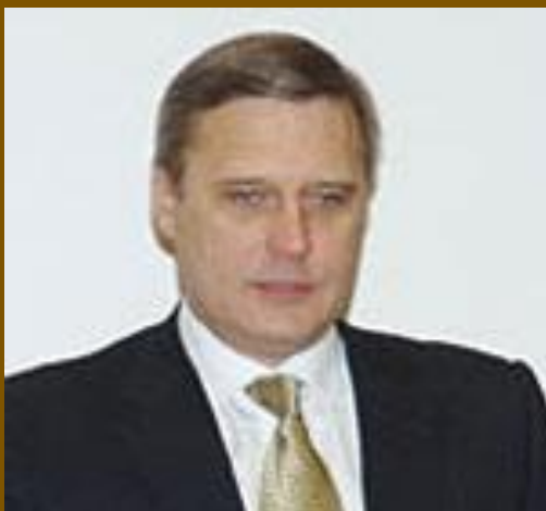
Председатель Правительства М.М. Касьянов