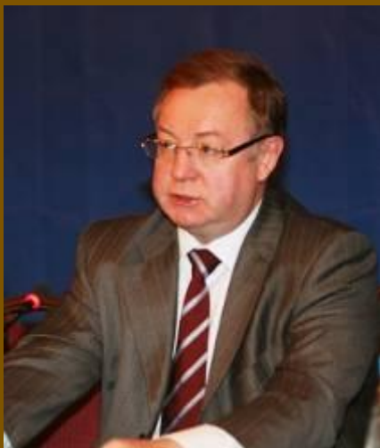
Председатель Счетной палаты Российской Федерации С.В. Степашин