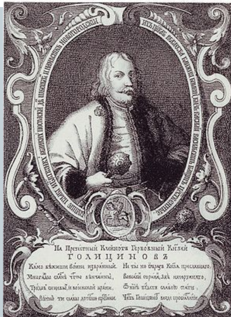
Фаворит Софьи князь В.В. Голицин