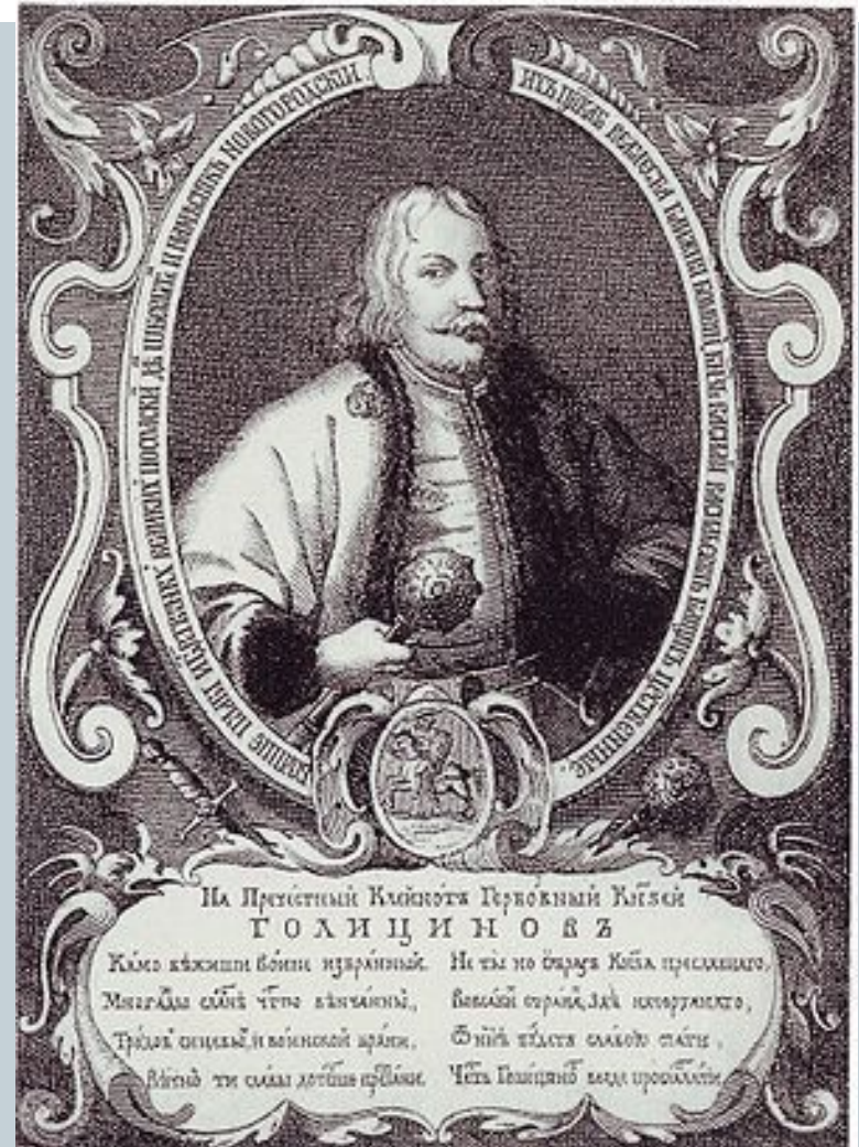
Фаворит Софьи князь В.В. Голицин