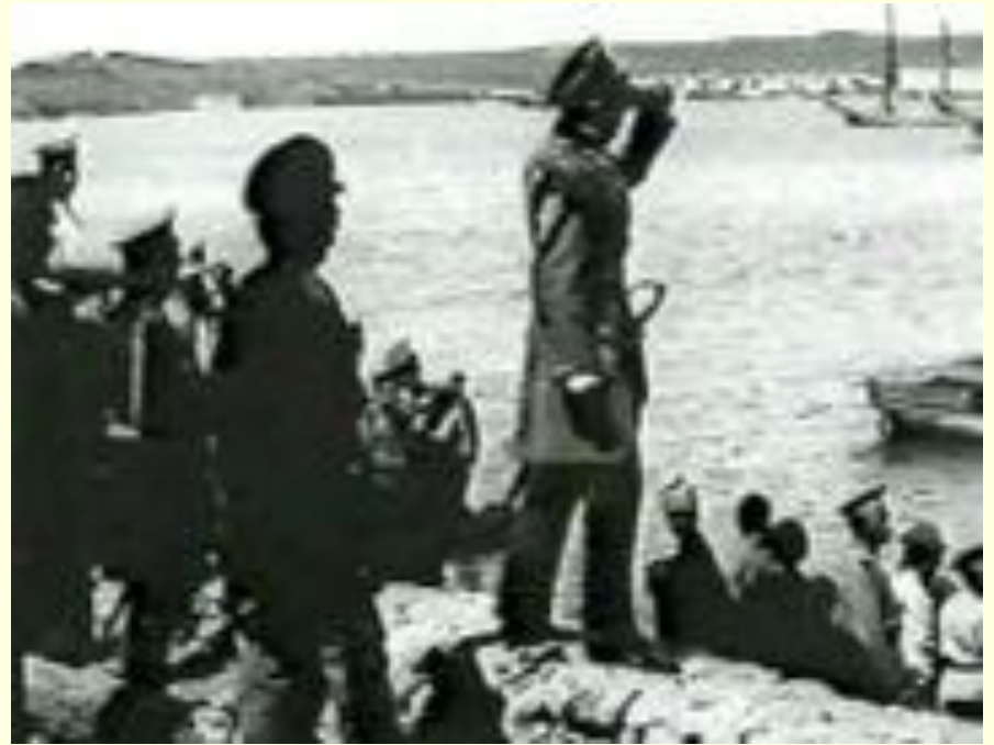
Кадр из фильма «Оборона Севастополя»