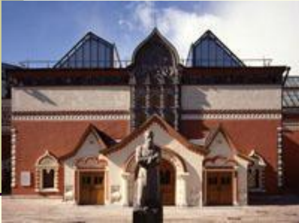
■ Третьяковская галерея