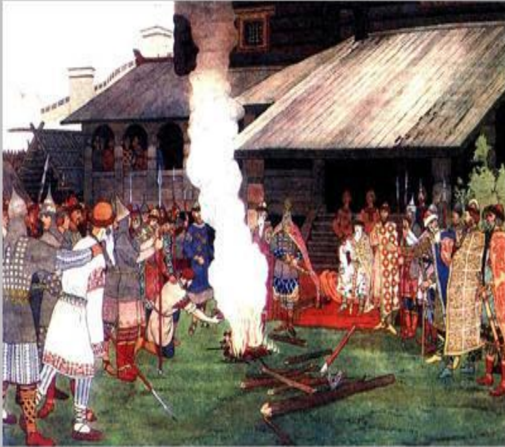
И. Билибин Суд во времена "Русской правды"

Правдой Ярославичей (сыновей Ярослава Мудрого) именуются статьи 19–41 в тексте Краткой Правды .