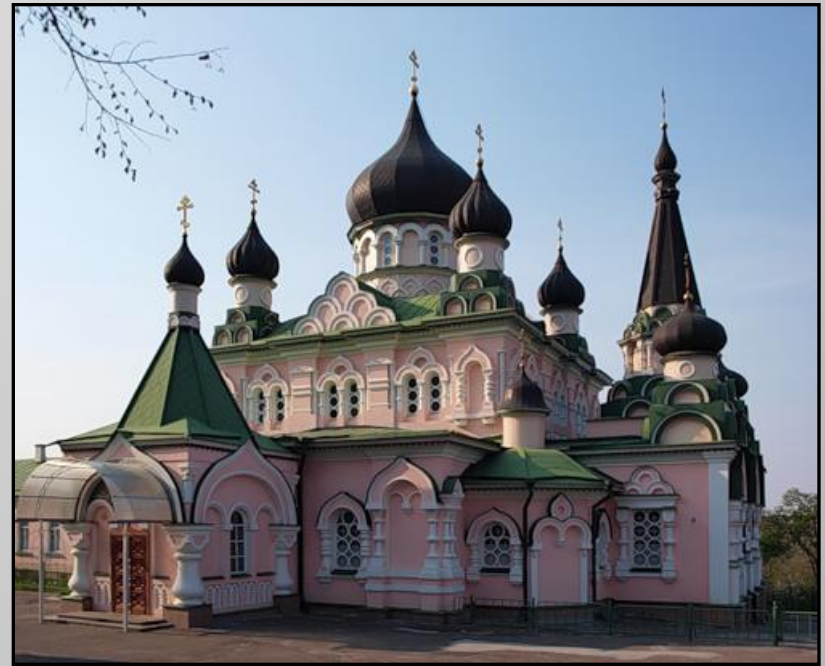
Покровский женский монастырь.