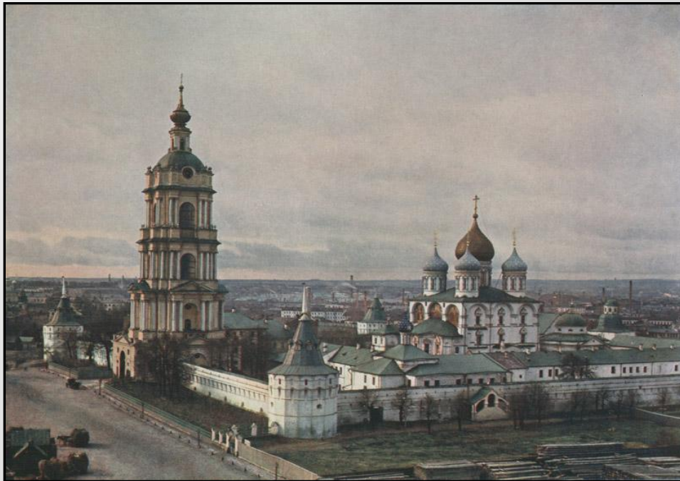
Новоспасский мужской монастырь в Москве

Во второй половине века в стране растет число монастырствующих (черное духовенство). К концу 90-х гг. насчитывается 450 мужских монастырей, где обитали 8 тысяч монахов о 7,5 тысячи послушников. Женских обителей к этому времена было 250. В них нашли приют 7 тысяч монахинь и 17 тысяч послушниц. По сравнению с дореформенным временем черно духовенство возросло в 3 раза.