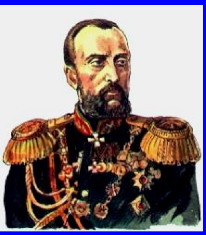
Николай Николаевич. Главнокомандующий русской армии.

Соотношение сил складывалось в пользу России, но военная реформа не была завершена и армия испытывала недостаток в новейшем вооружении и высших командирских кадрах.