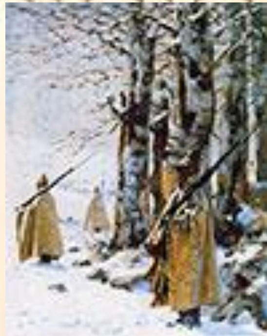
В.Верещагин. Пикет на Балканах