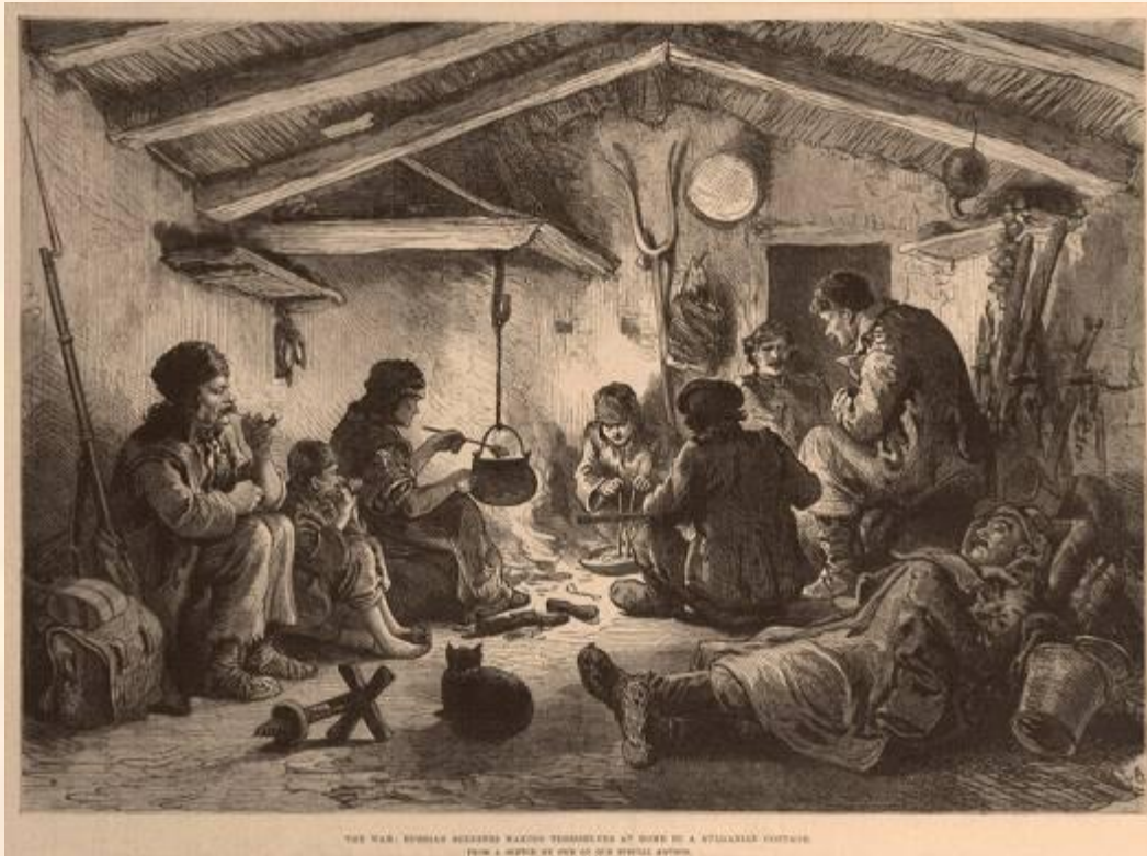
Русские солдаты на постое в болгарской семье