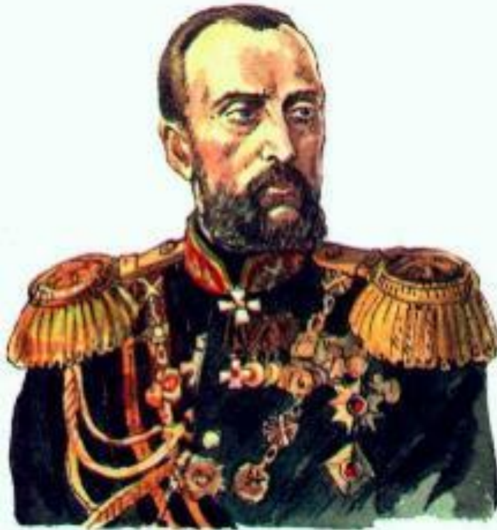
Николай Николаевич. Главнокомандующий русской армии.

12.4.1877 г. Александр II объявил войну. Соотношение сил складывалось в пользу России, но военная реформа не была завершена и армия испытывала недостаток в новейшем вооружении и высших командирских кадрах.