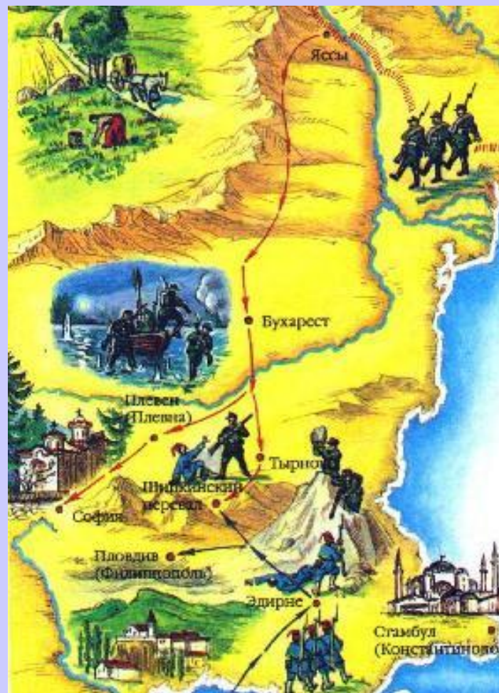
Карта боевых действий.

Летом 1877 г. русская армия вступила на территорию Румынии и перешла р. Дунай. Болгары восторженно встречали освободителей.