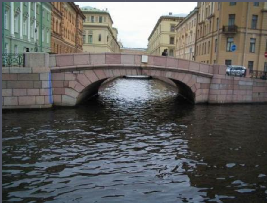
Второй зимний мост