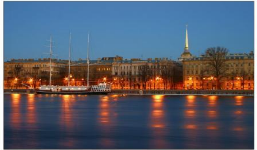
Набережная у Адмиралтейства