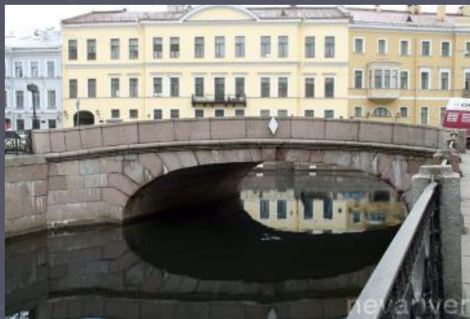
Первый зимний мост