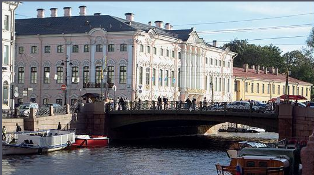
Полицейский (зеленый) мост