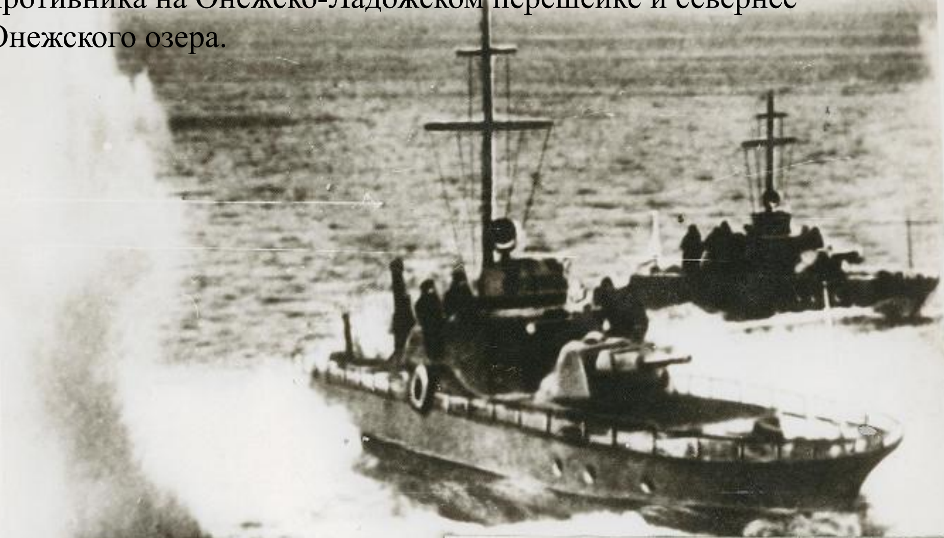
Бронекатера Онежской флотилии в бою

32-я и 7-я армии при поддержке Онежской, Ладожской военных флотилий и 7-й воздушной армии имели задачу разгромить противника на Онежско-Ладожском перешейке и севернее Онежского озера.