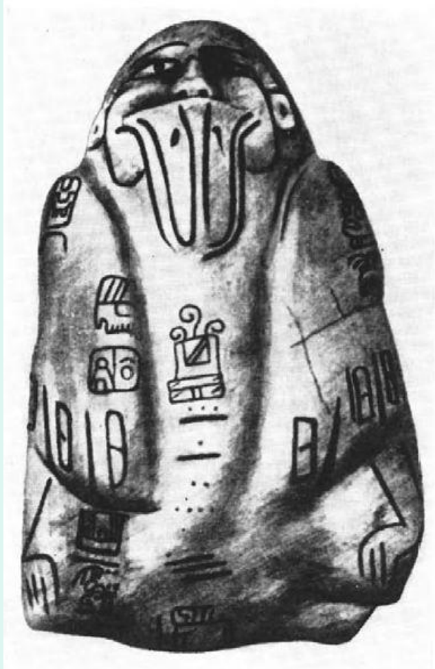
96. Нефритовая статуэтка из Сан-Андерес-Тустла. Мексика