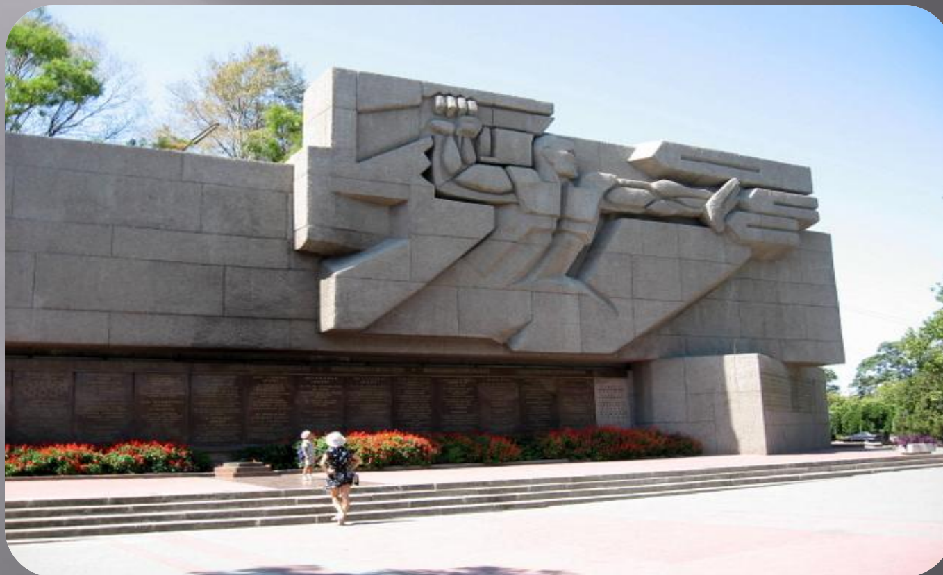
Монументальный памятник посвященный подвигу защитников Севастополя