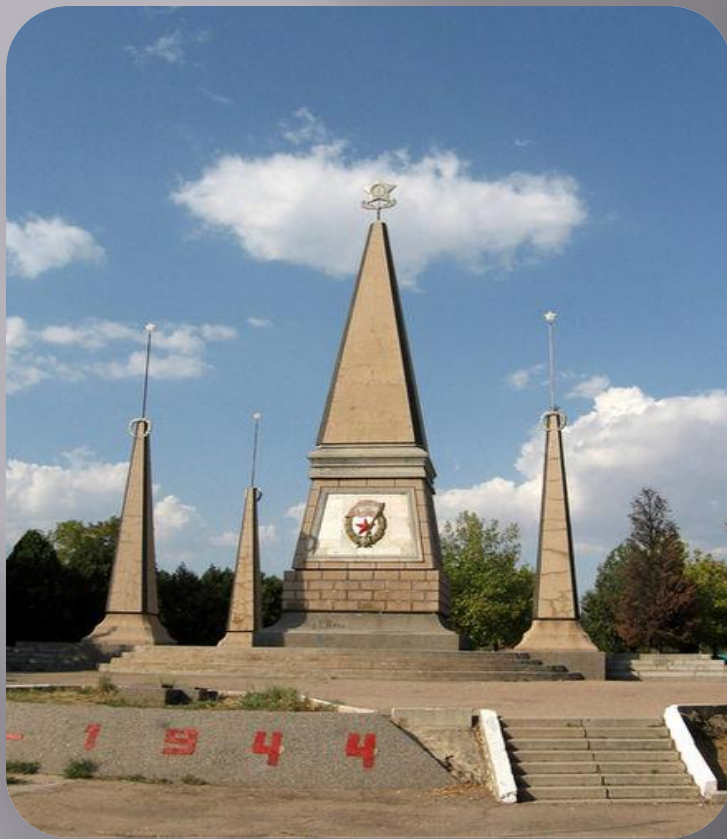
2 гвардейская армия