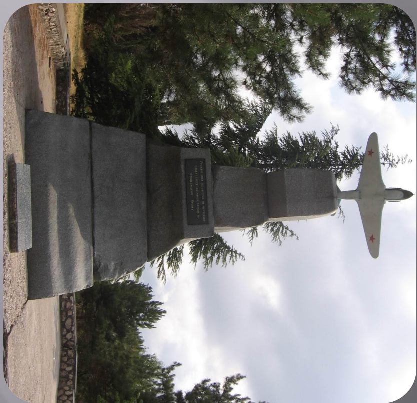
Памятник летчикам 8-й воздушной армии