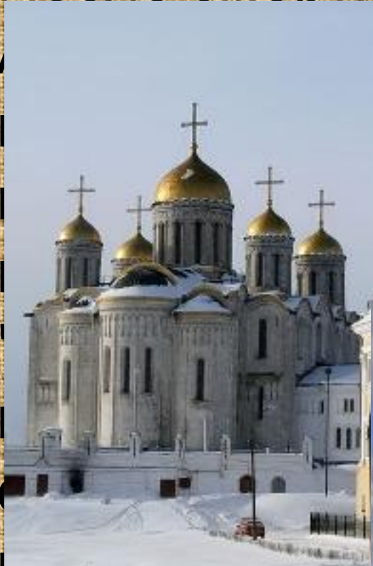
Перенес стол Успенский собор (1158-60 гг., перестроен 1158-60 гг.)

следовал киевский киевский престол. Тогда он переехал в Ростов, суз м. Опираясь на св