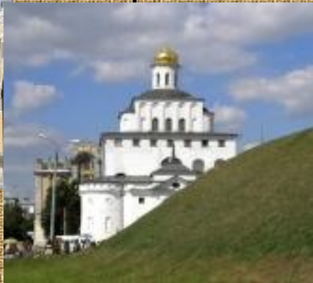
Золотые ворота 1158-64гг.