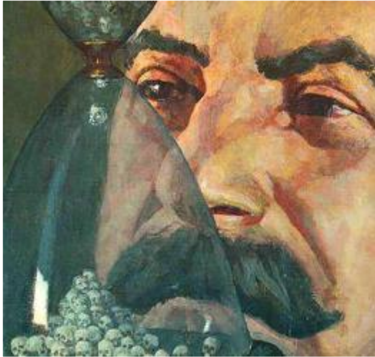
П.Белов. Песочные часы.

В 30-е гг. была завершена ликвидация разномыслия в художественной культуре. Отныне искусство должно следовать одному направлению-социалистическому реализму и показывать жизнь такой, какой она должна быть в представлении партийных вождей. Искусство стало насаждать мифы и создавать иллюзию, что счастливое время уже наступило. Используя его власти умело манипулировали общественным мнением и направляли его в нужное русло.