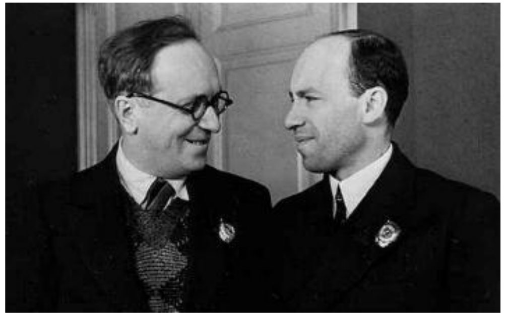
И. Дунаевский и В. Лебедев-Кумач.

Развитие музыки было связано с именами С. Прокофьева, Д. Шостаковича, Т. Хренникова, И. Дунаевского. Появились музыкальные коллективы - Большой симфонический оркестр, квартет им. Бетховена и т. д. При оценке творчества композиторов огромную роль играли вкусы вождей, поэтому жесткой критике подвергся Д. Шостакович. Своего расцвета достигло песенное творчество. Произведения И. Дунаевского, Б. Мокроусова, М. Блантера, братьев Покрасс знала вся страна.