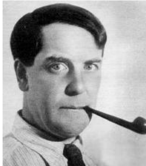
А.Иоффе и П.Капица

Несмотря на идеологическое давление представители естественных наук смогли добиться выдающихся успехов. С.Вавилов(оптика), А. Иоффе(физика кристаллов), П.Капица (микрофизика), И. Курчатов(ядерная физика) и др. обогатили мировую науку. Химики Н.Зелинский, А.Бах, С.Лебедев сделали фундаментальные открытия в области получения искусственных веществ и органических пищевых про-