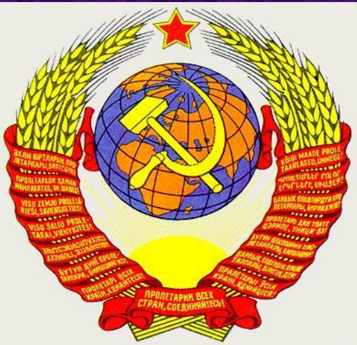
Флаг и герб СССР

Большевики собрали большую часть территории Российской империи в единое государство. Начался очередной этап развития Российского государства теперь уже в форме Союза Советских Социалистических Республик.