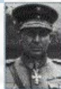
Генерал-майор Павло Галицкий (1897—1973)