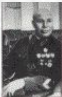
Тимошенко Семен Константинович (1895—1970)