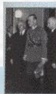
Главнокомандующий Карл Густав Эмиль Маннергейм (1867—1951)