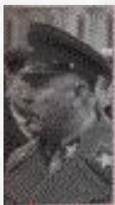
Ворошилов Климент Ефремович (1881—1969)