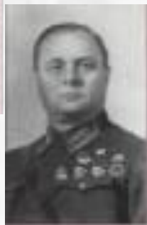
Мерецков Кирилл Афанасьевич (1897—1968)