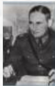
Генерал-лейтенант Херта Эстерман (1892—1975)